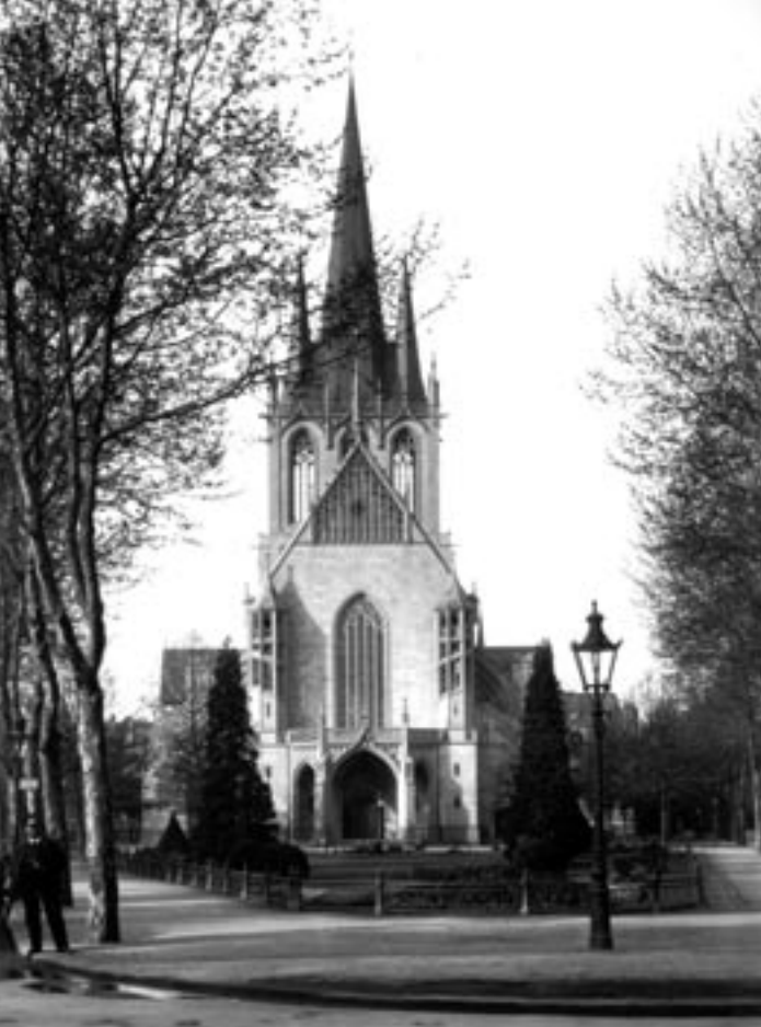
St. Paul, 1909