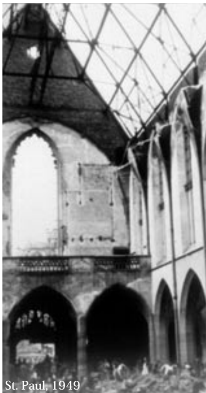
St. Paul, 1949

Kurz nach der Konsekration der Kirche im Jahre 1909 befasste sich eine