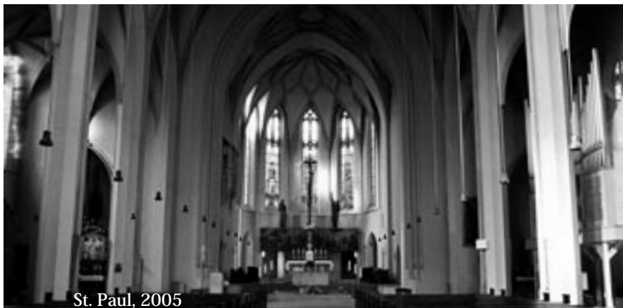
St. Paul, 2005